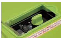
シンプルスイッチ