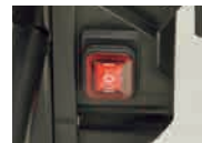
スイッチのみの簡単操作